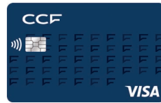
Carte Visa Classic