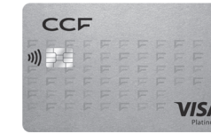
Carte Visa Platinum