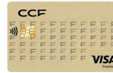
Carte Visa Premier